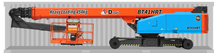
Перевозка в стандартном контейнере