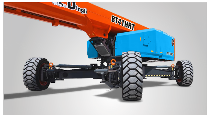
Совершенно новая технология выдвижения мостов одной кнопкой на месте эксплуатации. Глобальная патентная защита