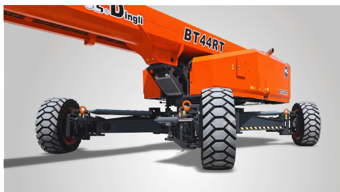
Совершенно новая технология выдвижения мостов одной кнопкой на месте эксплуатации. Глобальная патентная защита