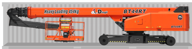
Перевозка в стандартном контейнере